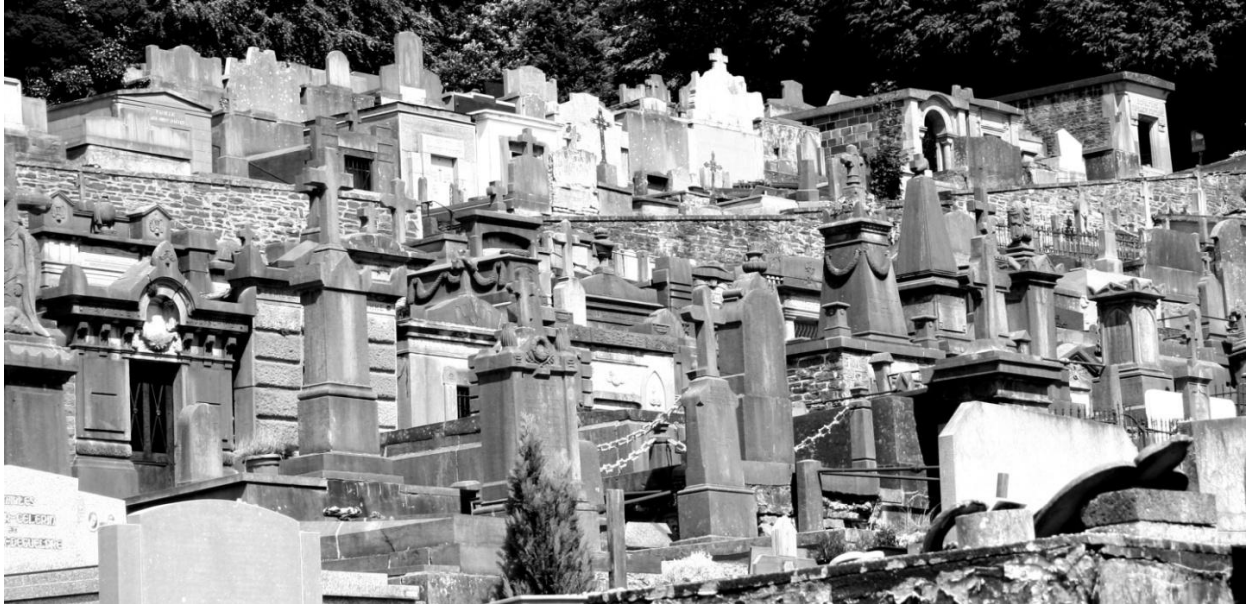
Fig.1 Reeds van aan de ingangspoort valt de gelaagde plaatsing van de graven tegen de helling op.