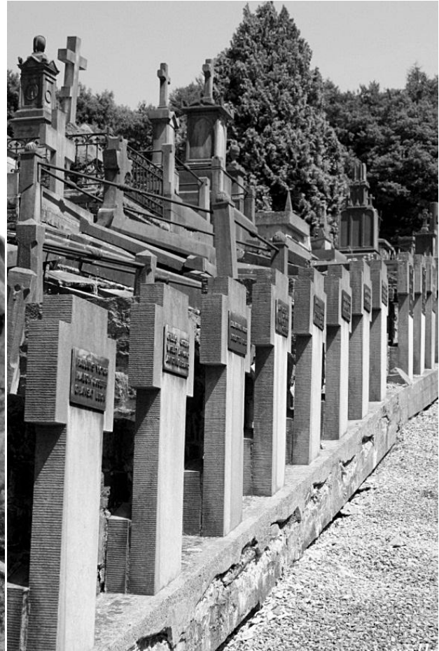
Fig. 16 Veertig kruisen van gedeporteerde burgers gered door het offer van weerstander Gridelet.

Zoals op veel Waalse kerkhoven is de herinnering aan de wereldoorlogen steeds aanwezig. Vaak is het een eenvoudig plaquette van de Belgische driekleur op de zerk van een oud-strijder. Maar naast het monument voor burgerslachtoffers, raakt ons de rij van 40 steles van gijzelaars die gered werden door Eugène Gridelet. Deze weerstander werd door de bezetter in 1942 in de citadel van Luik gefusilleerd nadat hij alle schuld voor de sabotagedaden van zijn medeburgers op zich had genomen. Een andere getuigenis van de absurditeit van de oorlog zijn de vier witte Commonwealth-graven van Canadese militairen die de loopgraven in Frankrijk overleefden, maar die in december 1918 in Spa geveld werden door de Spaanse griep.