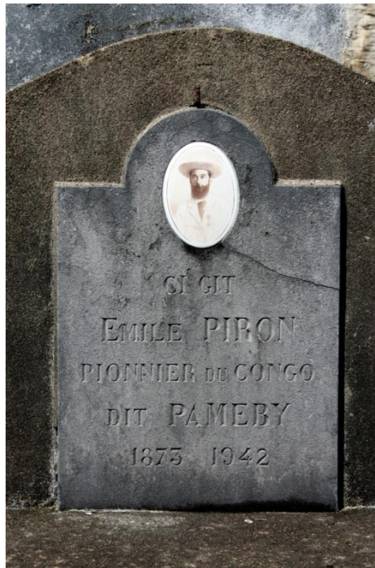
Fig. 14 Wallonië kende veel Congo-pioniers.