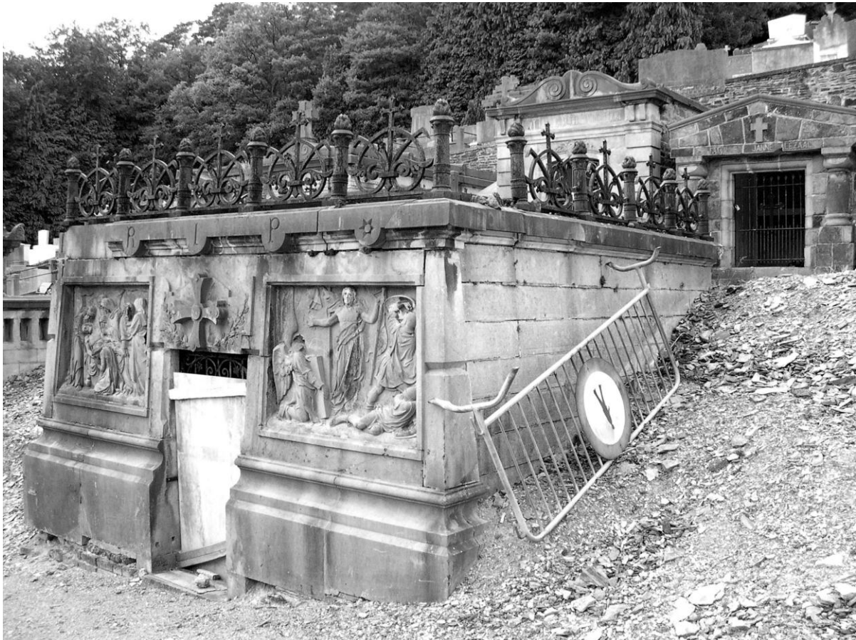
Fig. 9 Het mausoleum van de familie Facq-Baronheid (, één van de weinige graven met het betere beeldhouwerk.

De gevels worden versierd met symbolen die op de muur lijken gekleefd te zijn en niet echt in combinatie zijn met de stijl van het bouwwerk. Van uitzonderlijke kwaliteit is het mausoleum van Facq-Baronheid met bezijden de deur kwalitatief gebeeldhouwde reliëfs die de graflegging en wederopstanding voorstellen.