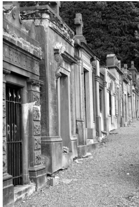
Fig. 4 In de gereserveerde percelen staan de “caveaux hors-sol” schouder aan schouder.