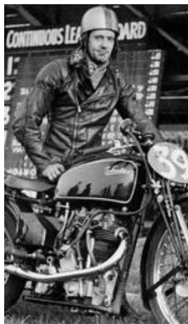
Fig. 11 http://www.ozebook.com/gpwin/documents/24.html

Sommige symbolen blijken specifiek voor Spa te zijn. Zo dragen verschillende graven een gebroken anker waarvan de betekenis en de context niet duidelijk zijn. Andere symbolen zijn gewoon uniek voor Spa zoals een jockeyuitrusting of de helm van een motorcoureur.