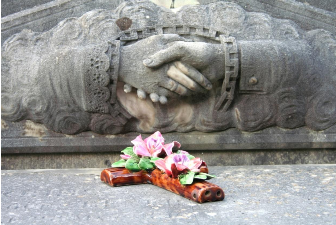
Fig. 12 "Alliance" van het echtpaar Renier, waarvan de eeuwige trouw nog eens benadrukt wordt door de gebonden ketting.