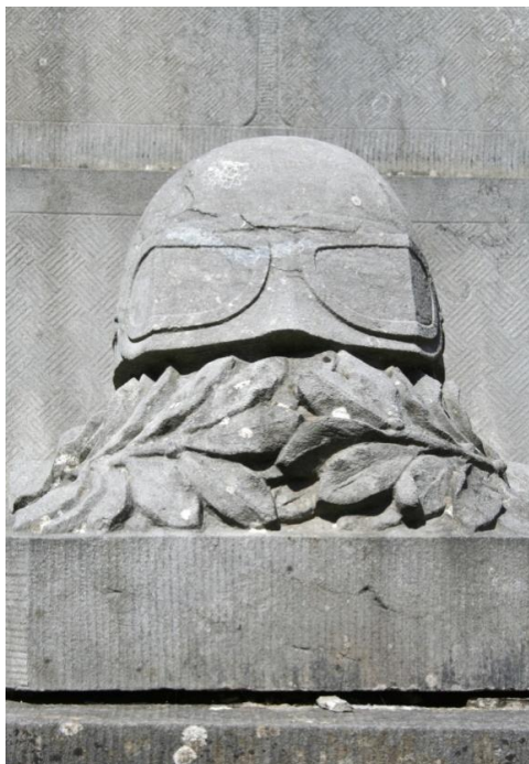
Fig. 10 Modern symbool: de helm van motorcoureur David Whitworth die in 1950 op het circuit van Francorchamps verongelukte.

Sommige symbolen blijken specifiek voor Spa te zijn. Zo dragen verschillende graven een gebroken anker waarvan de betekenis en de context niet duidelijk zijn. Andere symbolen zijn gewoon uniek voor Spa zoals een jockeyuitrusting of de helm van een motorcoureur.