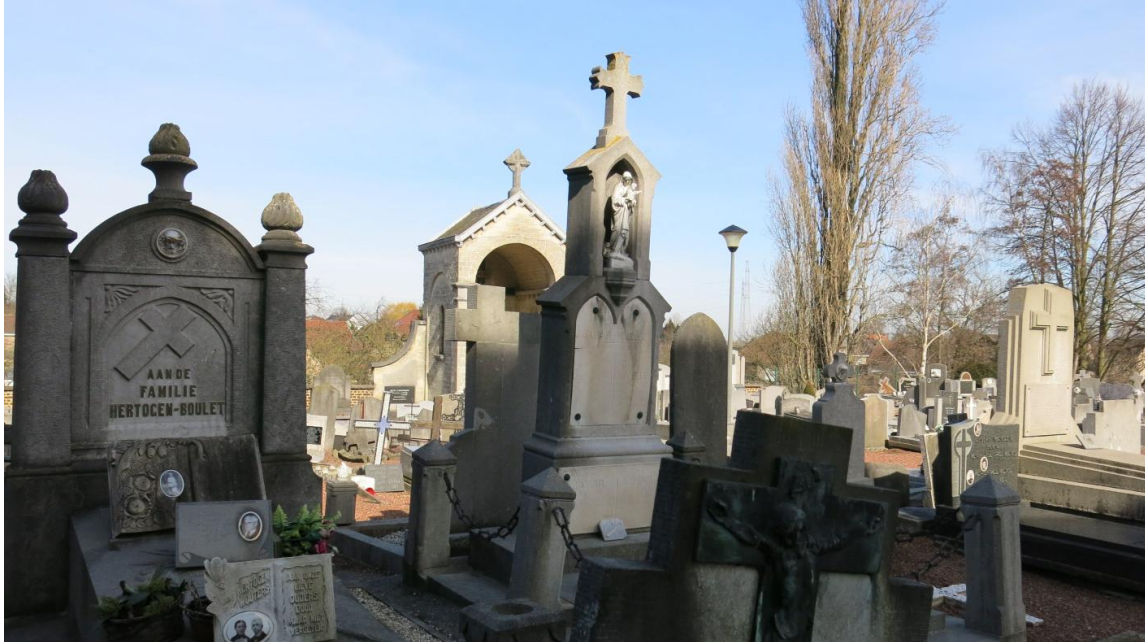
Kerkhof Val-Meer (Riemst)

Zaterdag 30 mei tot en met zondag 7 juni 2015