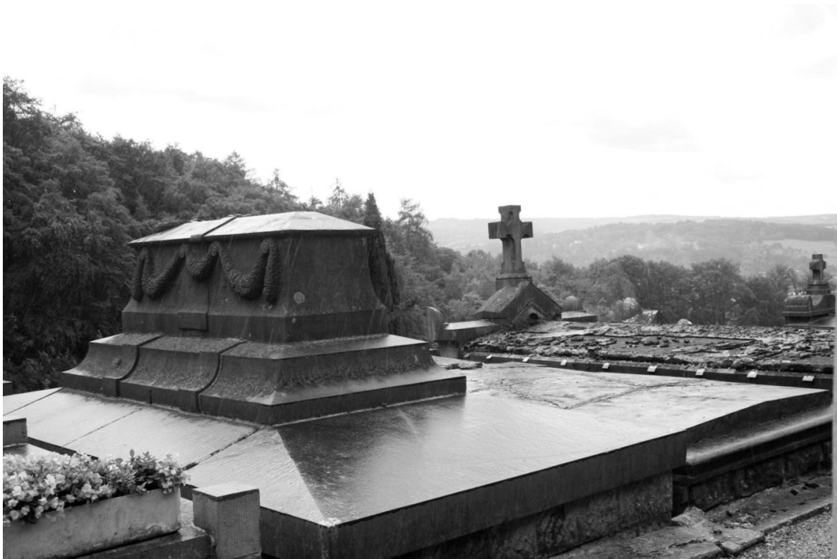
Fig. 8 De grafkelder is vaak de sokkel waarop de tombes pronken. De begraafplaats kijkt uit op de vallei van de Wayai waarin de stad Spa genesteld is.

Deuren komen er in tal van vormen voor. Vaak bestaan ze uit bronzen of ijzeren platen waarin openingen, maar ook grillen in gietijzer te zien zijn.