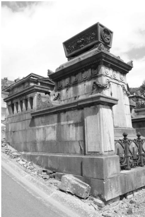
Fig. 3 De vrijstaande « caveaux hors-sol » waren bedoeld om langs alle kanten bewonderd te worden.

Zoals in veel Waalse stedse begraafplaatsen weerspiegelen de graftombes vooral de schitterende rijkdom en de individuele persoonlijkheid van de 19 de eeuw tot aan de Eerste Wereldoorlog, met nog interessante voorbeelden in het interbellum. Hoewel er van dan af aan meer mensen zich een eeuwige vergunning kunnen veroorloven, ontsnappen de grafzerken hier evenals elders niet aan een zekere monotonie van de serieproductie.