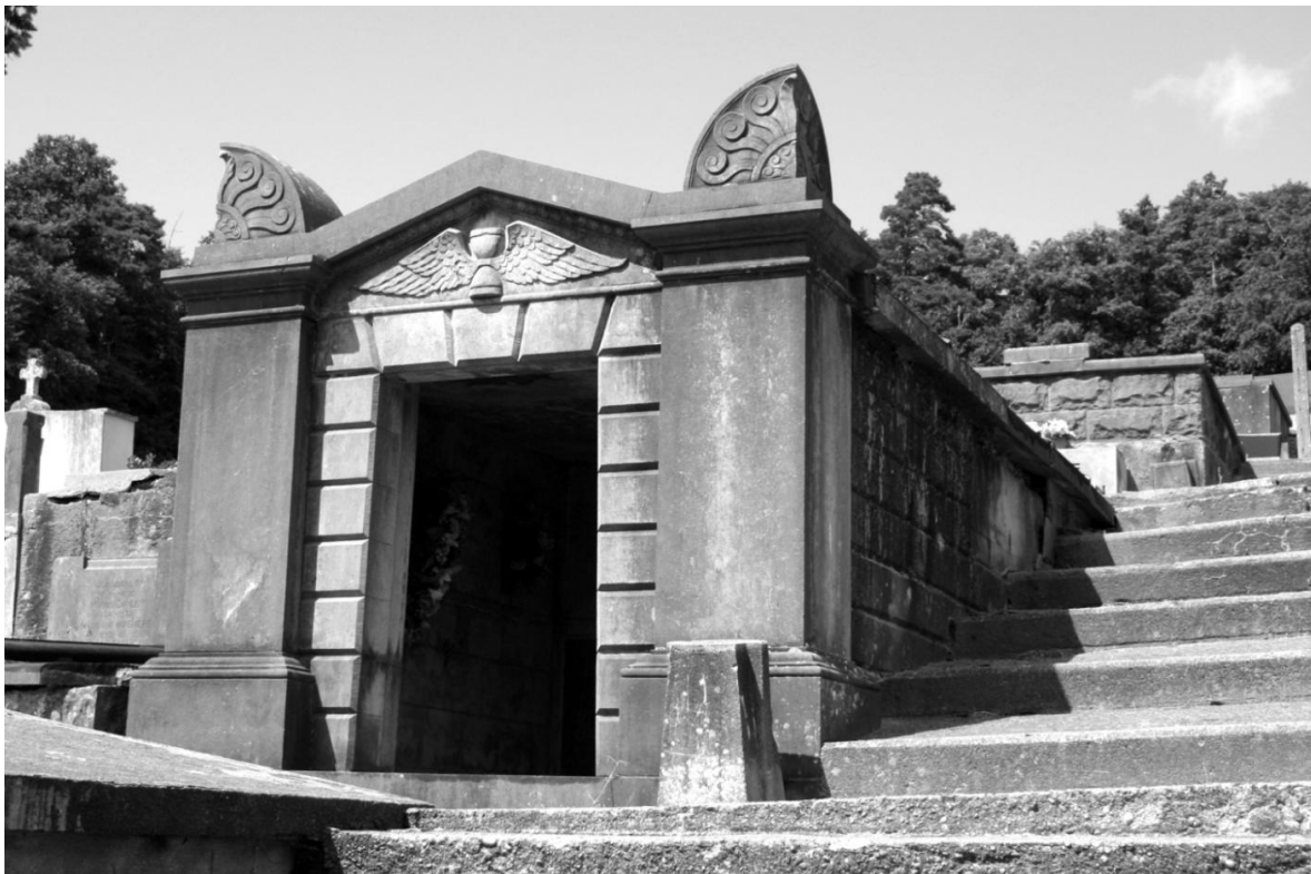
Fig. 7 Mausoleum half in de helling gebouwd