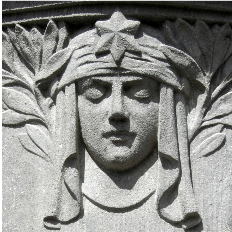
Fig. 18 Eén van de weinige uitingen van art nouveau.